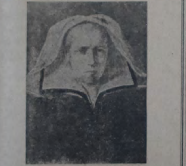
GUIDO RENI — "Retrato de mujer"