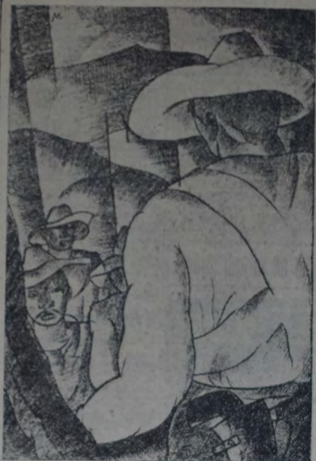
EN CADA JACALITO ESCONDIDO ENTRE LAS ROCAS ABRUPTAS se detenían y descansaban.

ENTRE las malezas de la sierra dormieron los veintidós hombres de Demetrio Macías, hasta que la señal del cuerno los hizo despertar. Pancracio la daba de lo alto de un risco de la montaña.