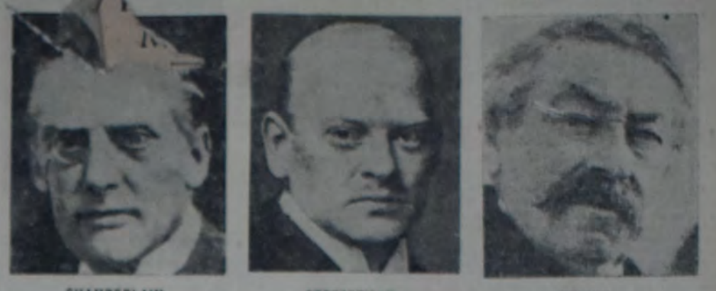
Me aquí las tres eminentes personalidades de la política europea que, según informa el cable, se ocupan seriamente en un proyecto para suprimir las barreras económicas del continente.